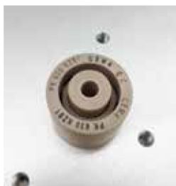
| 視覺辨識打標 |