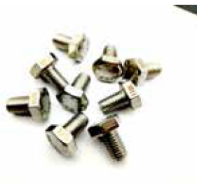
| 亂料打標 |