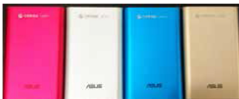
| 電子配件量產 |