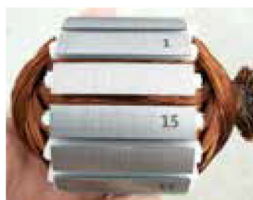
| 馬達零件標刻 |