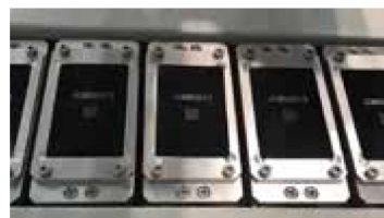
| 線上生產履歷 |