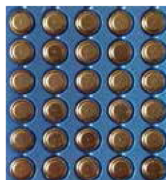
| 小元件打標 |