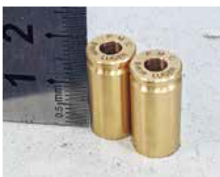
| 彈殼排列打標 |